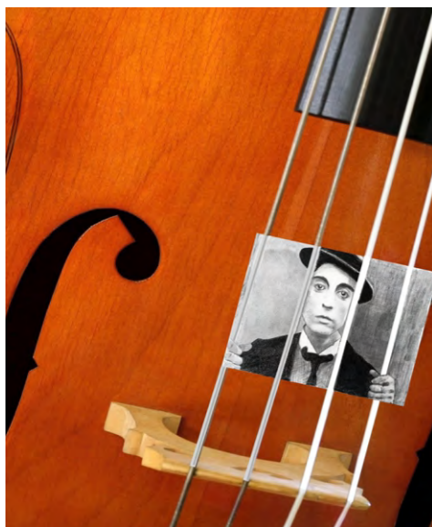
Contra-Buster: Keaton contra la cuerdas Dibujo a lápiz y montaje. Bezos&Brazos 2023.