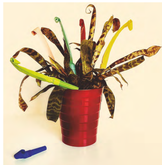
Planta asesina (MataSuegras). "Vriesea Splendens" Nombre genérico otorgado en honor de Willem Hendrik de Vriese, botánico, físico alemán y con graves problemas de relación con la madre de su mujer. Bezos&Brazos 2021.