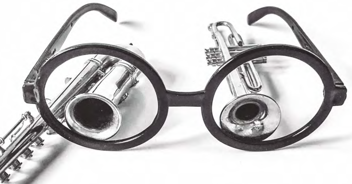
Tocaban a simple vista (relativa) pero tenían oído absoluto Bezos&Brazos 2023.