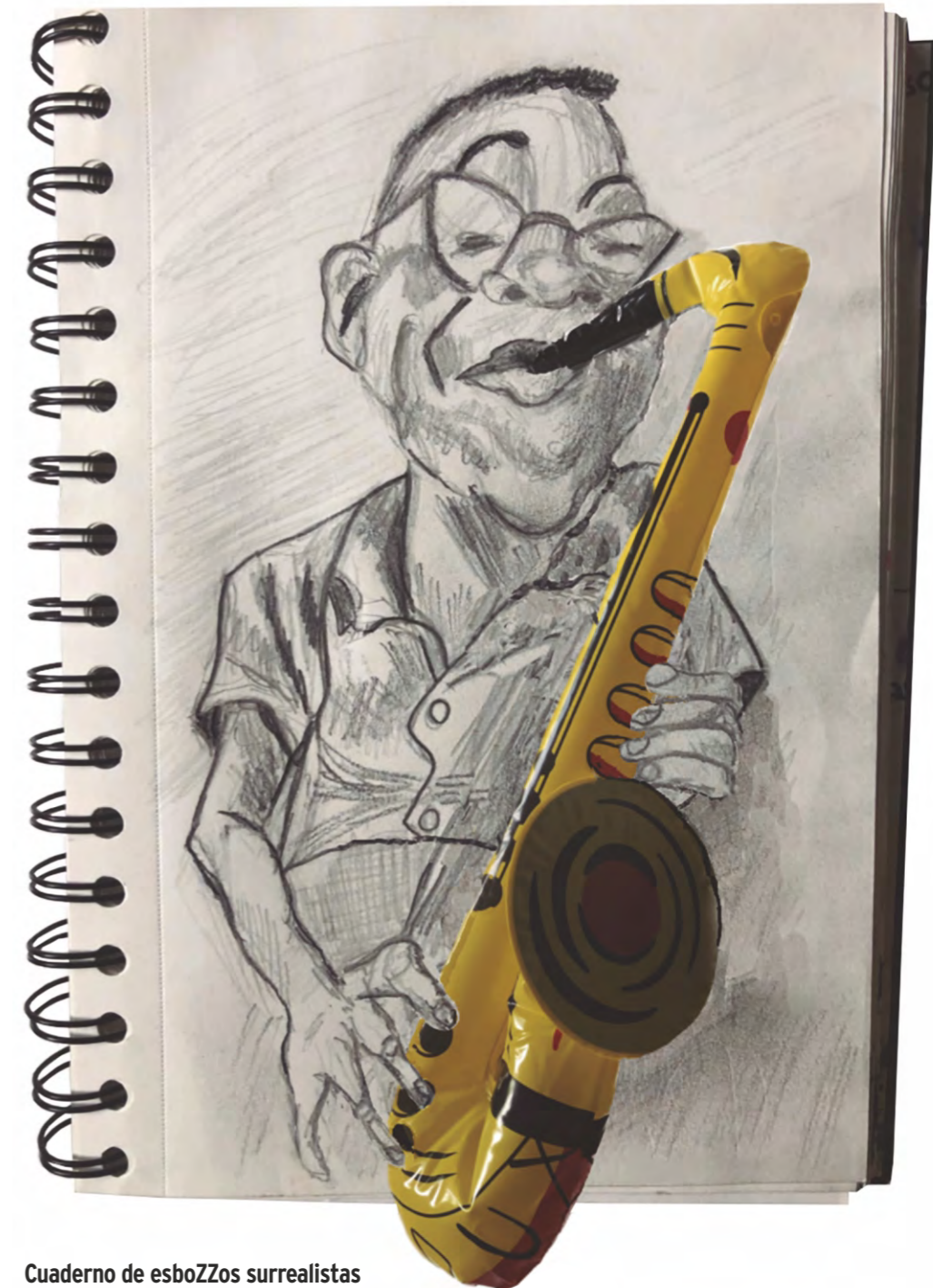
Cuaderno de esboZos surrealistas Serie: "dibujos a lápiz y cachivaches de mis nietas". Bezos&Brazos 2023.