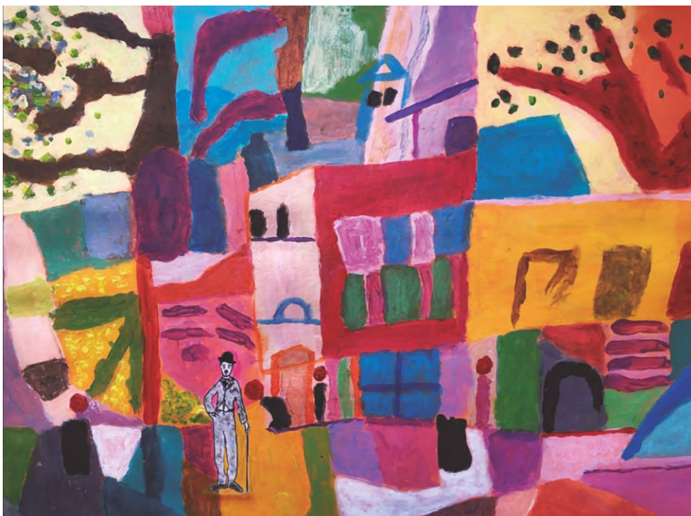
Charlot en Túnez Homenaje a Paul Klee. Acrílico sobre lienzo, rotulador negro. Bezos&Brazos 2022.

La exposición propone una mirada sobre lo cotidiano que nos rodea y descubrir la magia a través de los objetos, que con leves transformaciones (como la mezcla entre ellos o con retoques pictóricos), intentan convertir lo evidente en algo sorprendente y si llega el caso, provocar una leve sonrisa. Casi toda la obra esta creada en estudio, con objetos cotidianos de casa, donde se hacen los montajes y quedan luego plasmados en las fotografías que, en su mayoría, no tienen retoque digital. Y aquí entra en juego el juego, gracias al contraste de la imagen con los textos, títulos y música. Hay espacio para escuchar desde una posible banda sonora de algunas fotos o la lectura de textos propios y ajenos: breves cuentos, poemas, datos biográficos... Y unos títulos que tienen la función de despistar, tras el despiste inicial, y alargar la burla. La obra está inspirada en los grandes cómicos, la música, la pintura y otras ocurrencias.