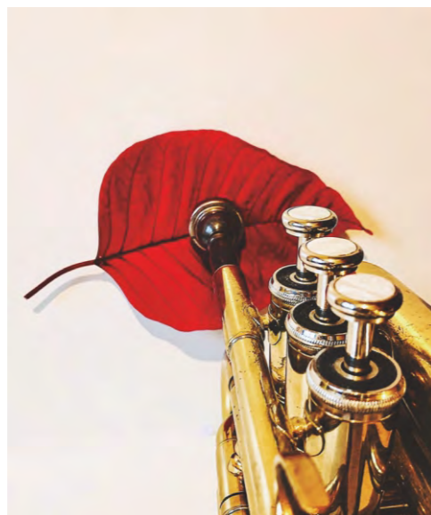
Bezos de Pascua (RAE: Bezo.- Labio grueso). Bezos&Brazos 2023.