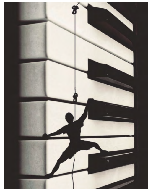
El Al-Pianista. Escala hacia el SOL (#sostenido) Serie: "Musicomik". Bezos&Brazos 2022.