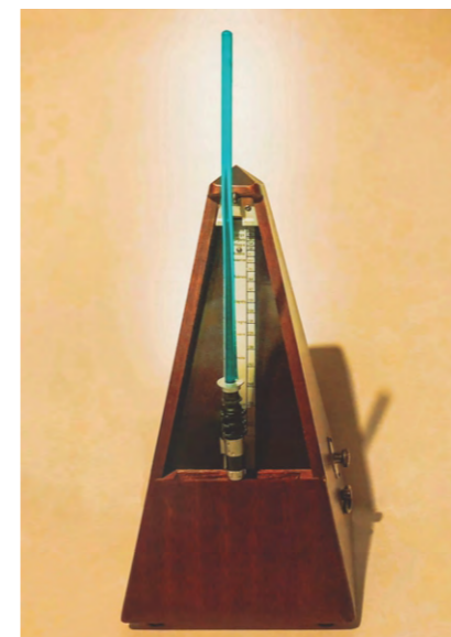
Metrónomo Jedi. "Que el tempo y el ritmo te acompañen" Bezos&Brazos 2021.